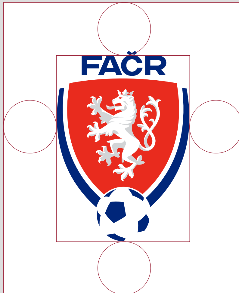
Schéma nalevo zobrazuje ochrannou zónu logotypu. Tuto zónu necháváme prázdnou, bez zásahu textu, obrázků nebo dalších log. Minimální velikost logotypu je zobrazena napravo.